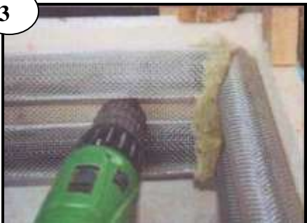
Monteras kant mot kant. Täta med Rockwool eller liknande i hörnen