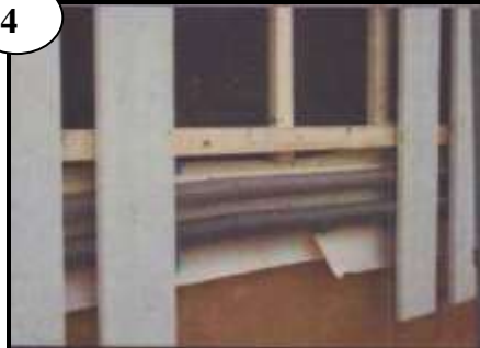
Minst 50 mm till spikreglar över och under