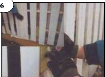
Luftspalter tätas med Rockwool eller Brandfogs-kum