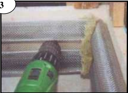
Monteras kant mot kant. Täta med Rockwool eller liknande i hörnen