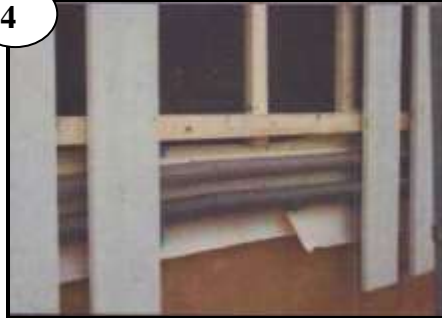
Minst 50 mm till spikreglar över och under