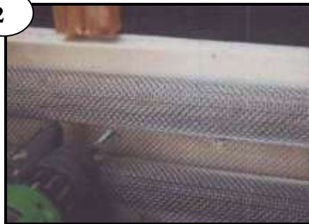
Fäst med skruv, 2-3 / meter