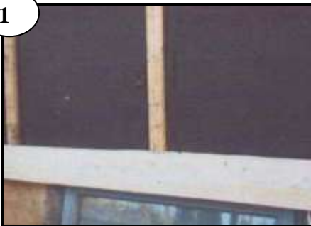
Vägg klar med anläggstyta.