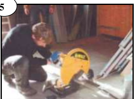
Ventil kapas med kapsåg