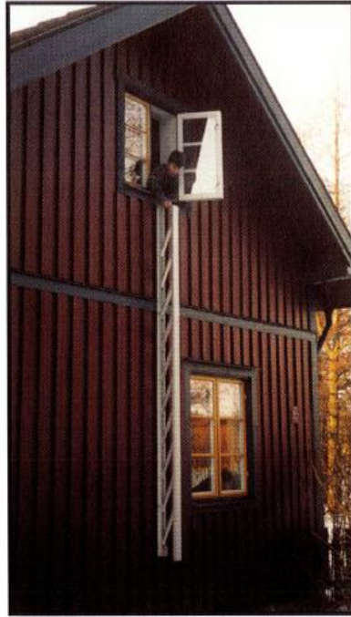
2. Stegen faller ut av sig själv