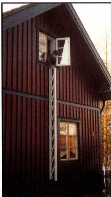
2. Stegen faller ut av sig själv