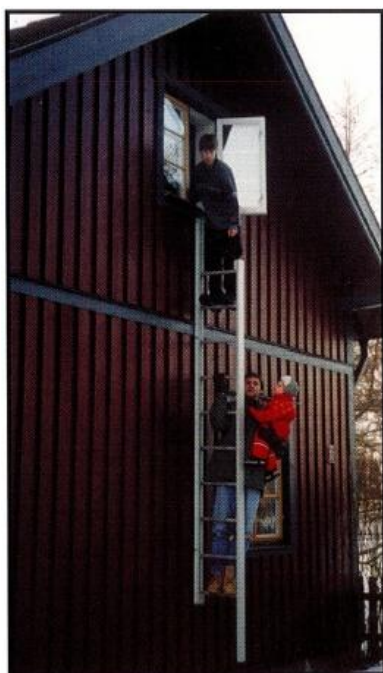
4. Ta ett stadigt tag i fönsterkarmen eller brädan och sätt en fot på lämpligt steg. Påbörja nedklättringen. Stegen bär en stor last varför det går bra att vara fler personer i stegen samtidigt.