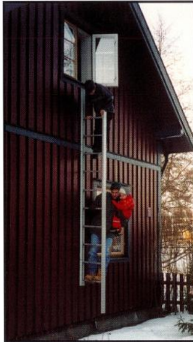
5. Klättra hela vägen ned på samma sida om stegen och håll stadigt i stegpinnarna eller den yttre profilen. Hela denna operation tar endast några få sekunder.