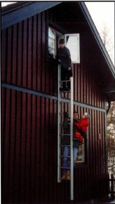
4. Ta ett stadigt tag i fönsterkarmen eller brädan och sätt en fot på lämpligt steg. Påbörja nedklättringen. Stegen bär en stor last varför det går bra att vara fler personer i stegen samtidigt.