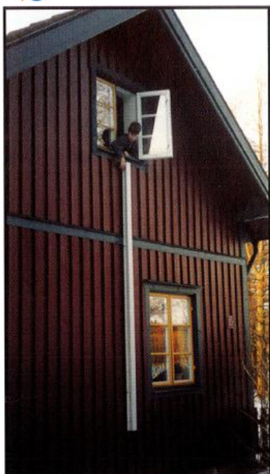
1. Öppna fönstret och dra ut sprinten som låser stegen