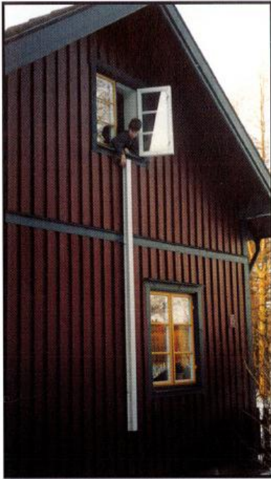
1. Öppna fönstret och dra ut sprinten som låser stegen