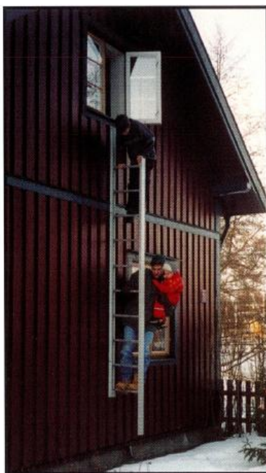
5. Klättra hela vägen ned på samma sida om stegen och håll stadigt i stegpinnarna eller den yttre profilen. Hela denna operation tar endast några få sekunder.