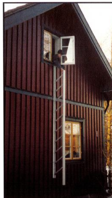
3. Stegen är klar att användas